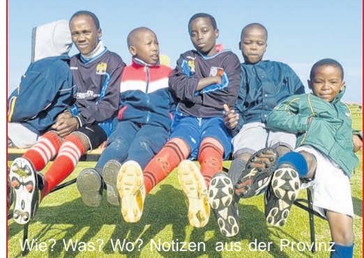
Wie? Was? Wo? Notizen aus der Provinz